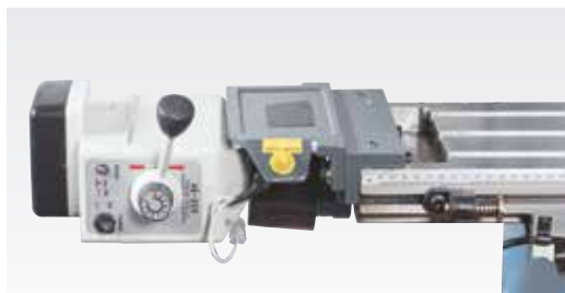
Stufenlos regelbarer Frästischvorschub