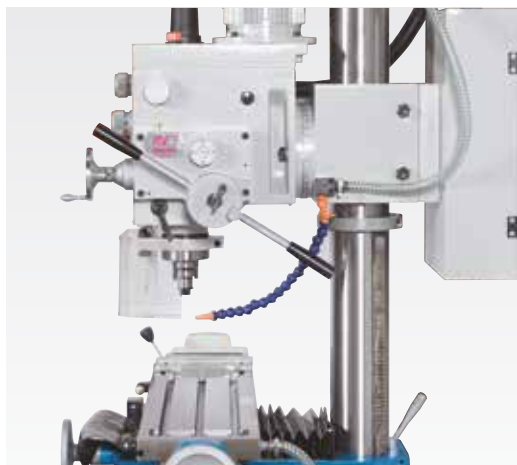
Automatischer Pinolenvorschub mit 3-Stufengetriebe