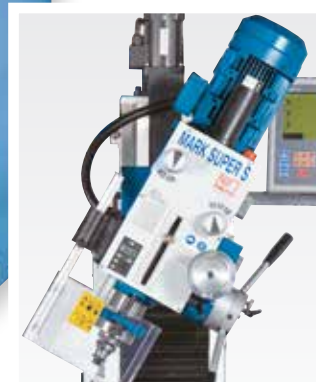
Kopf schwenkbar um \pm 45^\circ